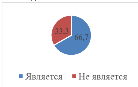
Рисунок 1. Ответ на первый вопрос (%).

На рисунке 1 представлены статистические данные, при ответе респондентов на первый вопрос: «Являются ли занятия физической культурой неотъемлемой частью вашей жизни».